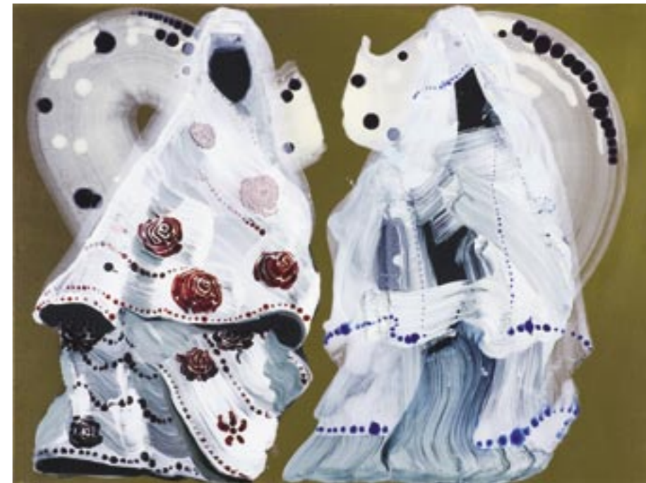
Babylon II olie en ei-tempera / doek, 65 x 80 cm, 2005

schilderijen: Danne van Schoonhoven www.dannevanschoonhoven.nl tekst + lay-out: Claudia Kool