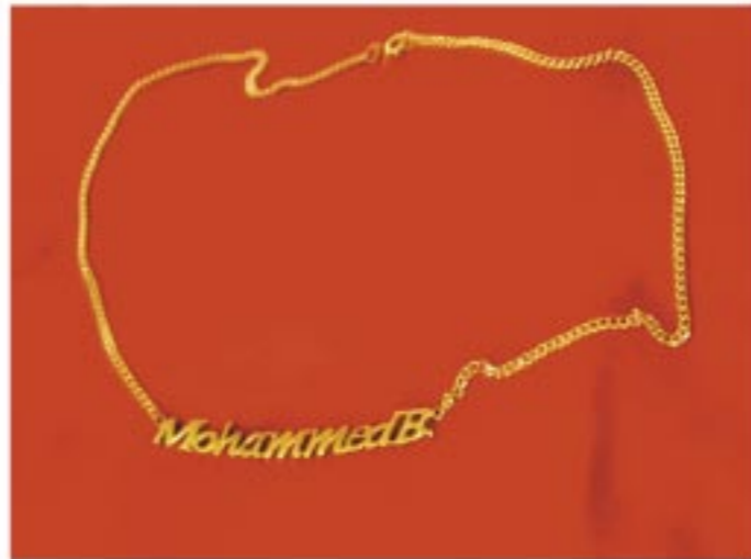
trash aesthetics and utopian dreams