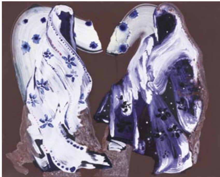
Babylon I olie en ei-tempera / doek, 65 x 80 cm, 2005

“Tijdens een reis door India in 2003 raakte ik geïnspireerd door deze traditionele kledij. Al snel ontvouwde zich het idee hoe ik dit tot uitdrukking wilde brengen in een schilderij. Ik meng vooraf alle verf die ik denk nodig te hebben en na een summiere schets voltooi ik het schilderij in één sessie van ongeveer drie kwartier, dit om de dynamiek van het onderwerp te waarborgen. De beweging van de kwast geeft het karakter van de gewaden weer”.